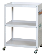
側パネルフック付タイプ

外寸/W600×D400×H810 ●全体耐荷重/96kg ●キャスター/50φゴムキャスター