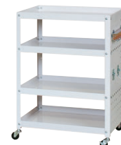
側パネルフック付タイプ

外寸/W600×D400×H810 ●全体耐荷重/96kg ●キャスター/50φ ゴムキャスター ●付属品/フック、HFD-6 /HF-12/HFR-11/HF-T2各1個